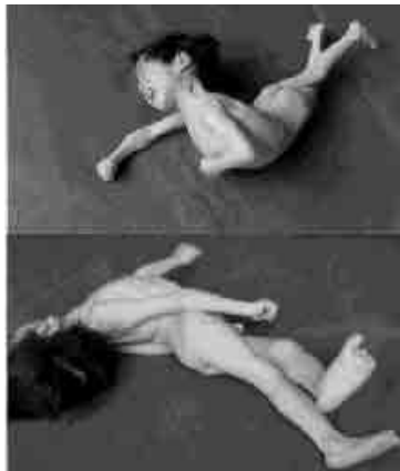
Tonische Labyrint Reflex

Op grond van waarnemingen van zich ontwikkelende embryo's, baby's en peuters heeft men in de Westerse wereld 2 geconcludeerd dat motorische ontwikkeling verloopt volgens een bepaalde volgorde in de tijd en voor elk mens in principe hetzelfde is. Wat is motorische ontwikkeling?