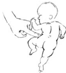
Ruggengraat bekken reflex

Men realiseert zich over het algemeen niet dat voor zowel inspanning als voor ontspanning energie nodig is. Elke van binnenuit op gang gebrachte verandering van de status quo kost energie. Wanneer deze energie in de vorm van b.v. bepaalde hormonen ontbreekt, kan men zich niet ontspannen ook al is men uitgeput.