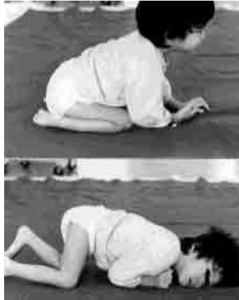
Symmetrische Tonische Nek Reflex

De STNR vormt de brug van buikkruipen naar op handen en voeten kruipen. Wanneer een baby op handen en knieën staat, zal hij met zijn kont op zijn hielen zakken wanneer zijn hoofd omhoog en naar achteren buigt. Terwijl zijn armen zich strekken. Buigt hij zijn hoofd naar voren, dan strekken zijn benen zich tot 90 graden en buigen zijn armen zodat hij door zijn armen met zijn neus op de grond zakt. Tijdens dit proces ondergaan zijn ogen het focussen van ver weg naar dichtbij.